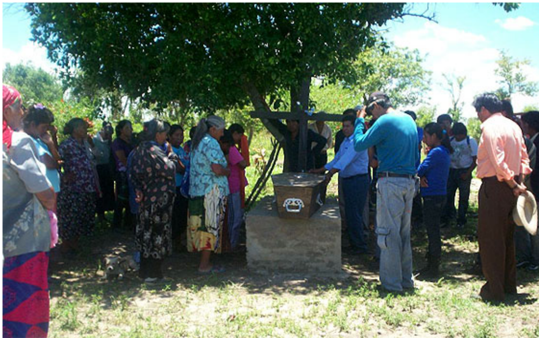
El luto llegó a la comunidad La Primavera en Formosa.

Otra vez, el conflicto territorial avanza a la vez que continúan las prácticas genocidas sobre los pueblos originarios. Esta vez, la represión del gobierno kirchnerista de Formosa causó la muerte de dos integrantes de la etnia qom. Y esto, la crítica interna de políticos oficialistas.